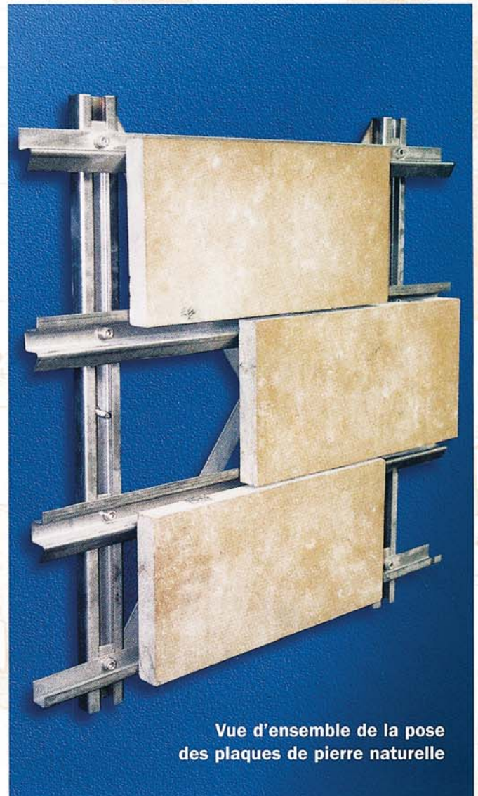
Vue d'ensemble de la pose des plaques de pierre naturelle