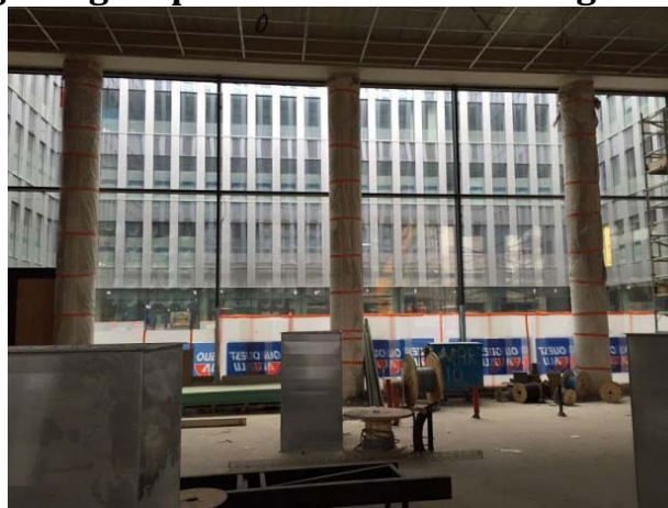
SMA-BTP © Grégoire Noble

Les balcons, traités en verre coupe-feu, n'auront pas de montants dans les angles, tandis que les arrêtes saillantes ont été proscrites. Des murs aux angles arrondis offrent un aspect plus durable car moins exposés aux chocs qui les marquent d'habitude. Un hall secondaire, situé sur la façade latérale, permettra au bâtiment d'être scindé en deux entités distinctes, si d'aventure la SMA souhaitait le mettre en location. "En attendant, il servira d'accès pour les personnels et de PC course pour le voilier que le groupe sponsorise", assure-t-on sur place. Il pourra également servir de zone de réunion ou de convivialité.