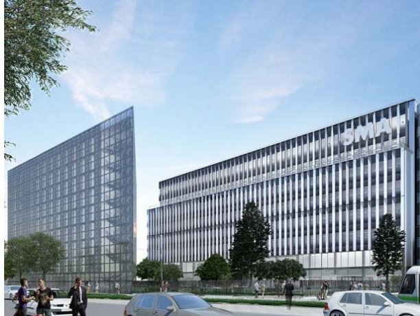
L'ancienne façade, aux éléments métalliques sur toute la hauteur © Wilmotte & Associés

Maître d'ouvrage : Bouygues Immobilier/BNP Paribas Estate