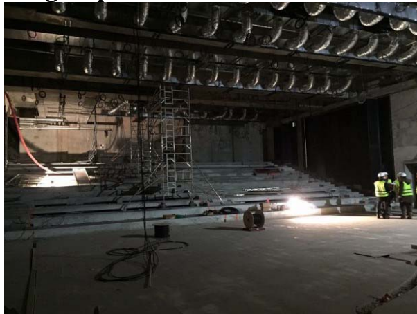
SMABTP © Grégoire Noble

L'auditorium, qui accueillera sans doute les "Trophées de la Construction" organisés par Batiactu à partir de 2018, comptera 380 places et pourra servir de lieu de conférence avec pupitre assis ou pupitre debout, mais également de salle de spectacle. Elle disposera d'un écran géant de 10 mètres digne d'une véritable salle de cinéma, d'un projecteur 4K et d'une acoustique particulièrement travaillée. Des panneaux de bois orientables disposeront de deux positions, l'une pour les concerts live améliorant l'acoustique, l'autre pour les projections, atténuant au contraire l'écho. Ce grand volume de 7 mètres de hauteur sous poutre a été ménagé entre les étages SS1 et SS2.