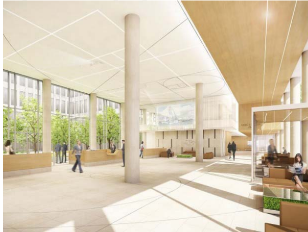
SMA-BTP © Wilmotte & Associés

En pénétrant dans le grand hall, les visiteurs seront surpris par la clarté des lieux. "Derrière la façade métallique, on apercevra le filtre de verdure qui sépare le bâtiment de l'hôtel", précise Cristina Cordera. "Le bâtiment est largement vitré, pour une grande luminosité, et ménagera de la transparence vers le jardin, en continuité des espaces intérieurs et extérieurs", poursuit-elle. Une hauteur double pour l'accueil permettra de transformer les lieux en espace d'exposition. Du côté des aménagements d'intérieur proprement dits, dessinés par JTPM Architecture, Philippe Mirailler, en charge du projet, nous dévoile : "Des matériaux de qualité seront utilisés, avec de la pierre claire (CHASSAGNE) sur les sols et aux murs. Le calepinage et le format des pierres suivent discrètement le fil conducteur discret du nombre d'or et de la proportion idéale. Ce n'est pas ostentatoire mais c'est présent" .