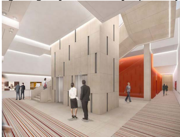
Siège SMA-BTP © Wilmotte & Associés

Le foyer qui desservira l'auditorium situé deux étages plus bas. Un accueil séparé permettra d'organiser des événements en dehors des heures d'ouverture du siège de la SMA.