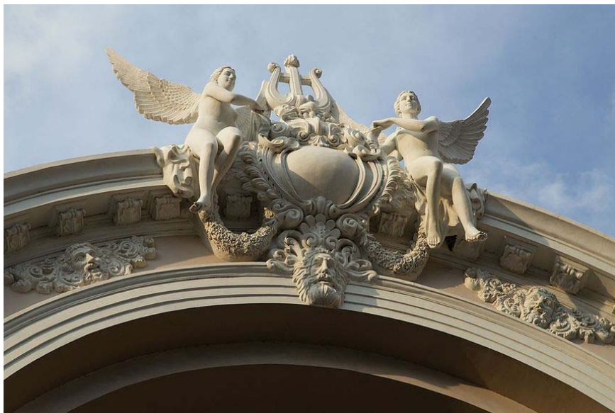
Sculpture de l'opéra en pierre de Lorraine

Cette pierre est d'ici... De la Meuse, en Lorraine, à Euville, où les carrières ont fourni la magnifique pierre blanche qui orne l'opéra parisien, mais aussi un peu plus loin le Pont Alexandre III, le grand et le petit Palais, dont les volutes Art Nouveau ne jugeraient pas à Nancy. Il y a aussi une partie de la façade du Louvre. Rien que notre point d'arrivée, à tous, par le train, est aussi en Pierre d'Euville. Quand on se promène gare de l'Est on se promène dans des murs Lorrains.