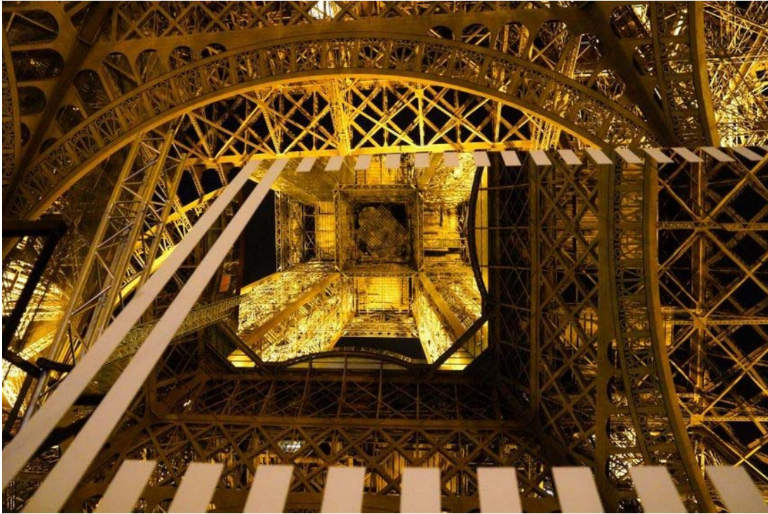
la tour eiffel est aussi Lorraine

Mais j'aurais pu citer la Tour Eiffel, tout à fait Lorraine, du sol au plafond, puisqu'on a forgé son fer ici chez nous, du côté de Pompey et de Ludres. J'aurais aussi pu citer les Champs Elysées dont les pavés sont quasiment tous nés bien loin de Panam, chez nous dans les Vosges. Je pourrais aussi parler de l'opéra Garnier, immense, chargé d'un grain de folie, dont la façade toute blanche vient tout droit de chez nous.