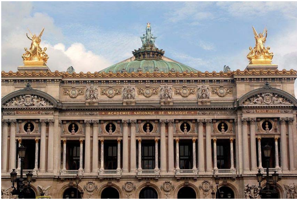
Façade de l'opéra de Paris

Cette pierre est d'ici... De la Meuse, en Lorraine, à Euville, où les carrières ont fourni la magnifique pierre blanche qui orne l'opéra parisien, mais aussi un peu plus loin le Pont Alexandre III, le grand et le petit Palais, dont les volutes Art Nouveau ne jugeraient pas à Nancy. Il y a aussi une partie de la façade du Louvre. Rien que notre point d'arrivée, à tous, par le train, est aussi en Pierre d'Euville. Quand on se promène gare de l'Est on se promène dans des murs Lorrains.