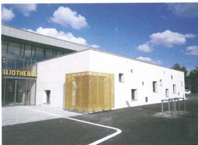
Bibliothèque de Beaufort