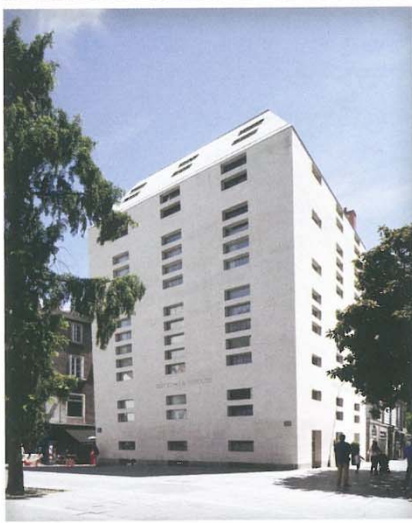
Hôtel La Pérouse de Nantes

Reconnue en France comme à l'étranger, ROCAMAT Pierre Naturelle extrait et transforme la pierre calcaire française depuis 1853 pour les principaux donneurs d'ordre que sont les grandes entreprises de BTP, les collectivités, les monuments historiques, les architectes et les acteurs de la filière pierre. L'entreprise exploite environ 25 carrières, soit 40 pierres calcaires différentes dans toute la France.