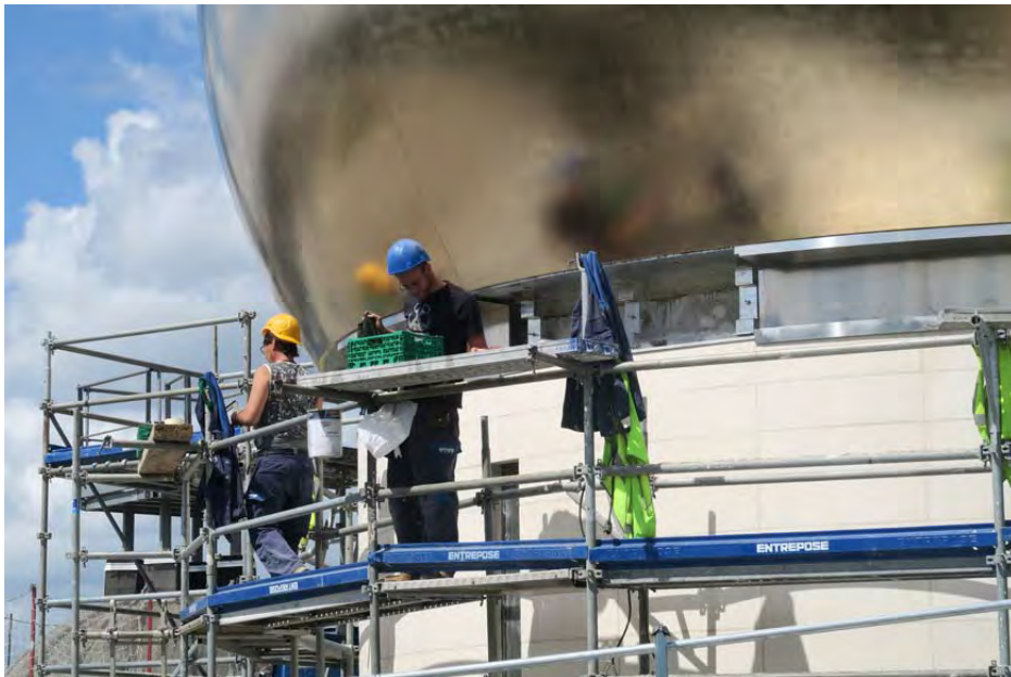
La coupole est en composites. La dorure a été réalisée par les célèbres ateliers Gohard, doreurs à Paris. Un alliage palladium-or a été posé. Il a été voulu mat, plutôt effacé, pour ne pas éclipser la Tour Eiffel toute proche.