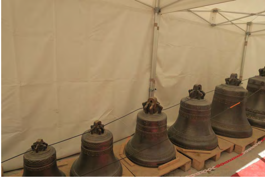
Les cloches, fondues en Russie, ont déjà été bénies mais n'avaient pas encore été montées, le jour où j'ai fait la visite, début juillet 2016.