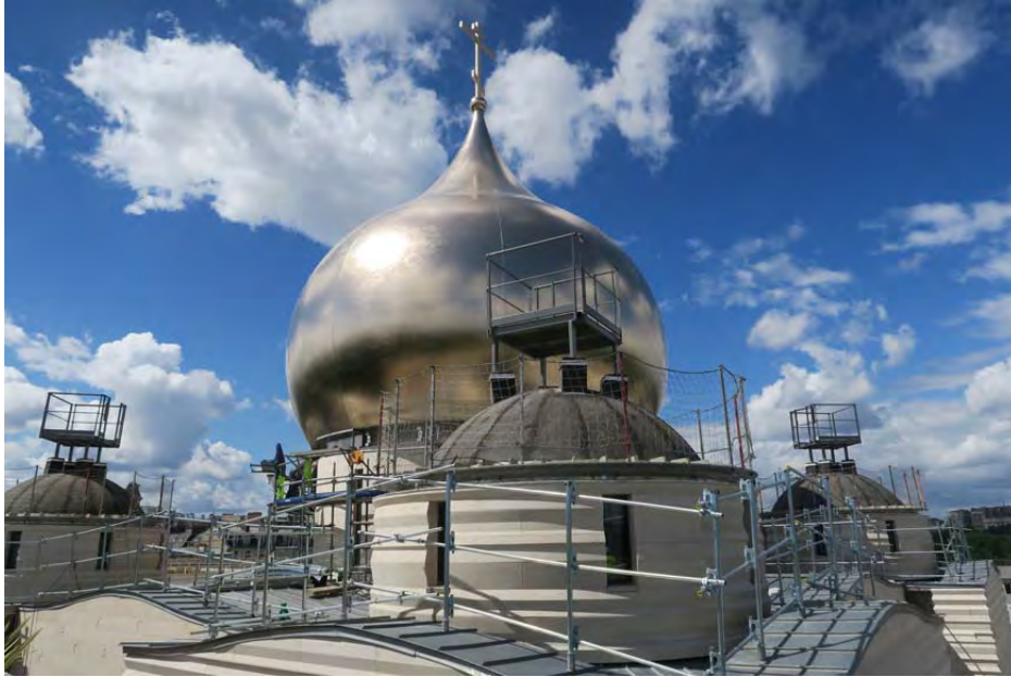
Les quatre petites coupoles d'angle n'étaient pas encore posées quand j'ai fait la visite.