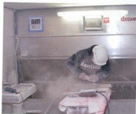
L'entreprise a réouvert une unité de taille de pierre manuelle dans laquelle œuvrent trois personnes. Elle est équipée notamment d'un multifonction manuel Sandra, d'un banc aspirant Ghines et d'une cabine d'aspiration des poussières Italmecc