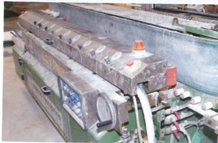
Au niveau du sciage secondaire, l'usine de Saint-Maximin possède cinq débêteuses Décamps, dont une de 2 m, deux de 1,5 m et deux de 0,7 m de Ø. Elle est équipée également d'un polissoir à chant LCV Marmo Meccanica.