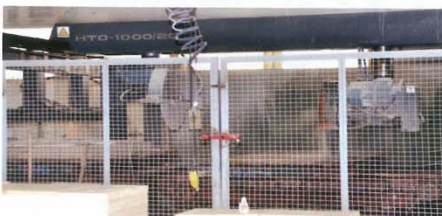
L’atelier est équipé d’une ligne de polissage à plusieurs têtes Gregori, d’une débiteuse automatique Canigo à double tête de sciage disposant de cinq tables de travail.