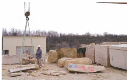
Sur le site de l’usine de Saint-Maximim dans l’Oise, 70 % de la production sont réalisés avec la pierre locale mais l’unité transforme aussi des blocs d’autres carrières comme ici un bloc de pierre de Chauvigny ou récemment 400 m3 de pierre de Vilhonneur.