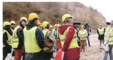
Le matin, la visite était consacrée à l'unité de transformation de Saint-Maximin et au show-room avec des architectes, prescripteurs et journalistes. L'après-midi, ce groupe en a rejoint un second, pour une visite de la carrière de Saint-Vaast-lès-Mello, en partenariat avec la Maison de la Pierre de Saint-Maximin.