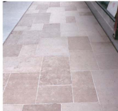
Le show-room de Saint-Maximin met en avant principalement des dallages et autres produits de construction de divers formats, finitions et matériaux issus des trente carrières de Rocamat.