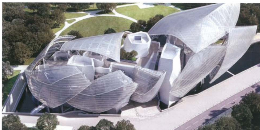
En haut, l'esquisse de Franck Gehry simplement crayonnée sur un carnet, et le bâtiment fini, posé dans le Bois de Boulogne à Paris

En effet, Rocamat a fourni tous les dallages et revêtements en pierre de Rocherons, matériau choisi par Bernard Arnault lui-même, pour son camaïeu de beiges et son fond légèrement rosé, avec très peu de coquilles. C'est aussi l'harmonie de la pierre avec les façades en Ductal Iceberg,