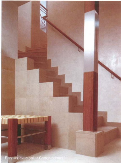
Escalier avec palier Corton adouci