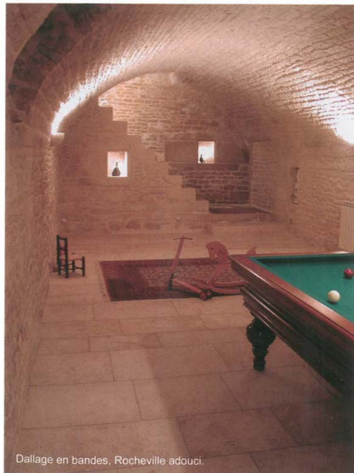
Dallage en bandes, Rocheville adouci.