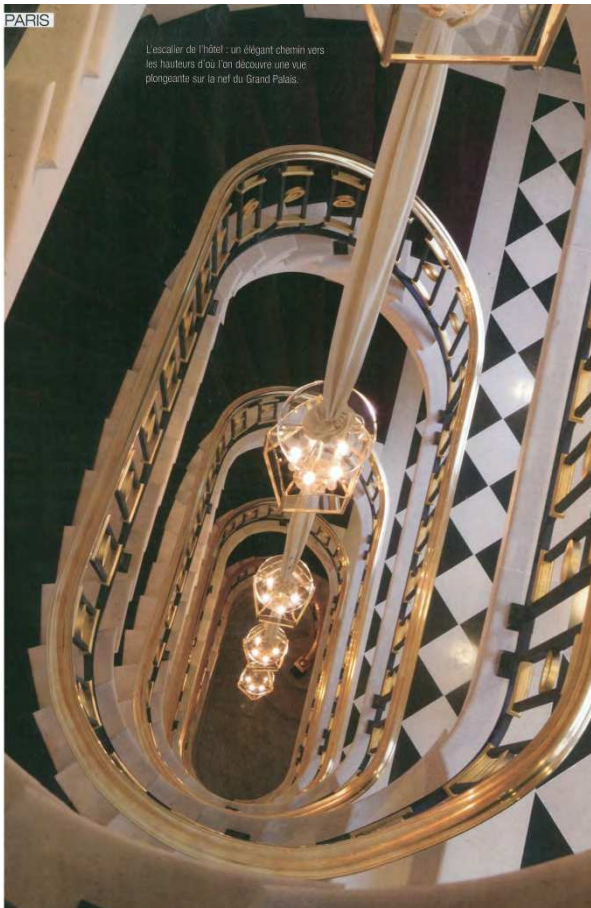
L'escalier de l'hôtel : un élégant chemin vers les hauteurs d'où l'on découvre une vue plongeante sur la nef du Grand Palais.