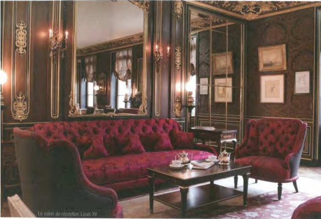
Le salon de réception Louis XV