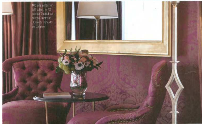
100 ans après son édification le 42 Avenue Gabriel est devenu l'adresse ultime du style de vie parisien.