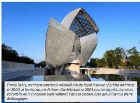
Franck Gehry, architecte américain médaillé d'or du Royal Institute of British Architects en 2000, et lauréat du prix Pritzker d'architecture en 2003 pour les façades, terrasses et trottoirs de la Fondation Louis Vuitton à Paris en octobre 2014 qui utilisent la pierre de Bourgogne.