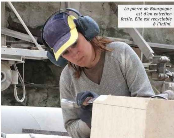
La pierre de Bourgogne est d'un entretien facile. Elle est recyclable à l'infini.

ELLES METTENT EN AVANT LE TERRITOIRE ET VALORISENT DES SAVOIR-FAIRE. INDICATION GÉOGRAPHIQUE (IG) POUR LES PRODUITS MANUFACTURÉS ET LES RESSOURCES NATURELLES, ET INDICATION GÉOGRAPHIQUE PROTÉGÉE (IGP) POUR LE SECTEUR AGRO-ALIMENTAIRE SONT AUSSI DES GARANTIES POUR LE CONSOMMATEUR. EXEMPLE AVEC L'IG PIERRE DE BOURGOGNE.