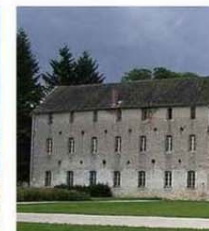
La pierre de Bourgogne a l'honneur à l'abbaye Notre-Dame de Cîteaux (21).