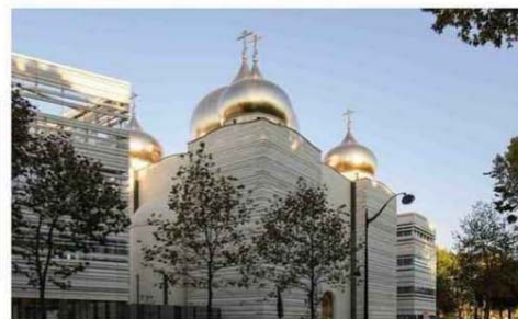
Pour le Centre spirituel et culturel orthodoxe russe à Paris, dont la construction a débuté en 2014 et a été finalisée en 2016, l'architecte français Jean-Michel Wilmotte a opté pour la pierre de Bourgogne.