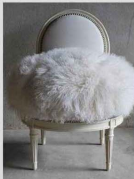
L'IG Siège de Liffol (88) a été la première attribuée en France. Ici un fauteuil Cupidon by Counot Blandin.

> L'IG (indication géographique) concerne quant à elle les seuls produits manufacturés et les ressources naturelles. Le dispositif, mis en place au niveau français, est géré par l'INPI (Institut national de la propriété industrielle), qui a en charge l'homologation des dossiers. Les deux premières IG ont concerné les sièges de Liffol (88) et le granit de Bretagne.