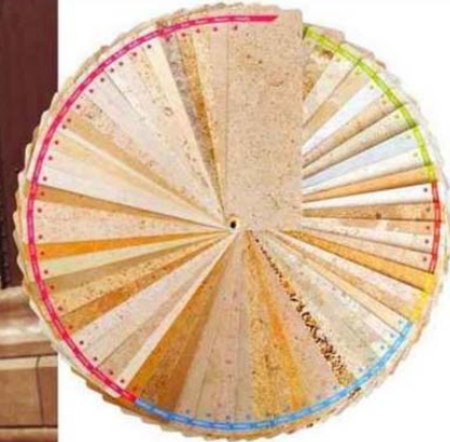
La pierre de Bourgogne s'exprime en un large nuancier de couleurs, du jaune au bleu en passant par le gris, le rouge...

www.ig-pierredebourgogne.fr www.pierre-bourgogne.fr