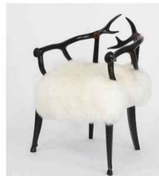
L'IG Siège de Liffol a été décernée en décembre 2016. Ici, un fauteuil cerf Henriot et Cie.