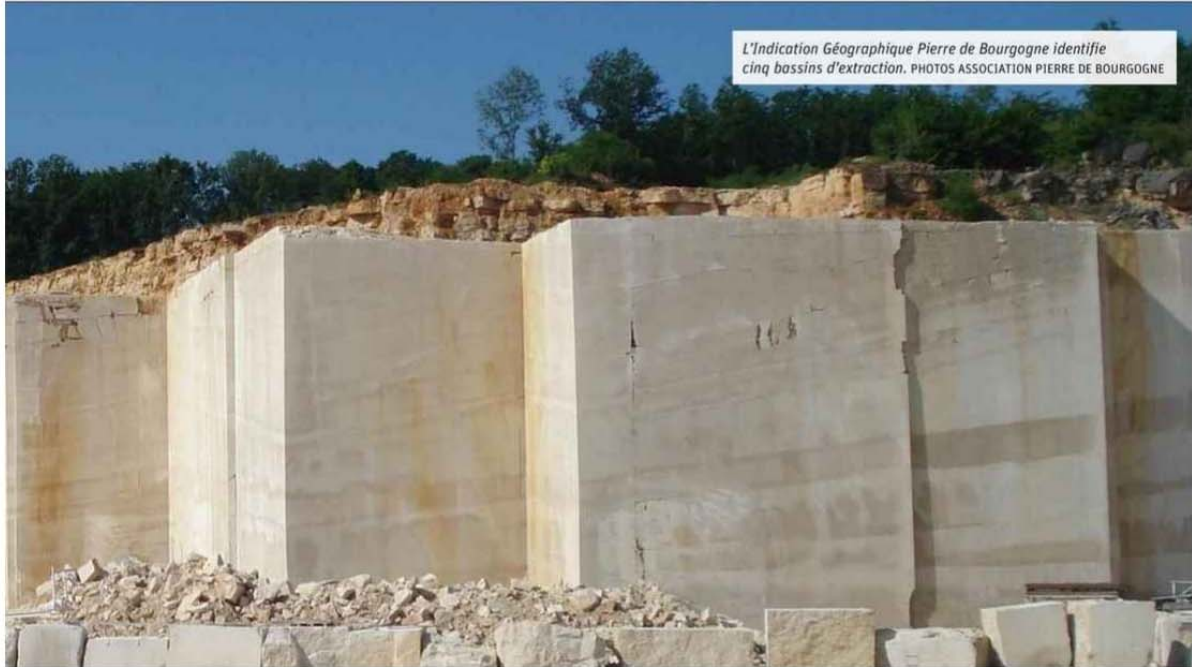
L'Indication Géographique Pierre de Bourgogne identifie cinq bassins d'extraction.