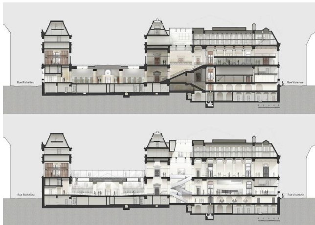
@Bruno Gaudin Architectes