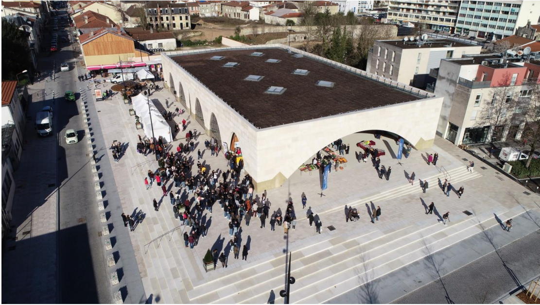
Jour de marché

Leur position privilégiée en plein cœur de ville et les horaires d'ouverture flexibles ont vocation à attirer le plus grand nombre et leur faire découvrir les savoir-faire locaux et les produits régionaux. Le tout incarné directement par les agriculteurs et exploitants qui pourront retracer leur histoire, leur rapport à leur domaine d'activité, et ainsi participer à la sensibilisation générale au "mieux manger" et au "mieux consommer".